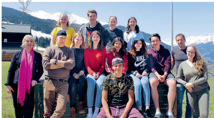
Gruppenfoto mit Leitungsteam.