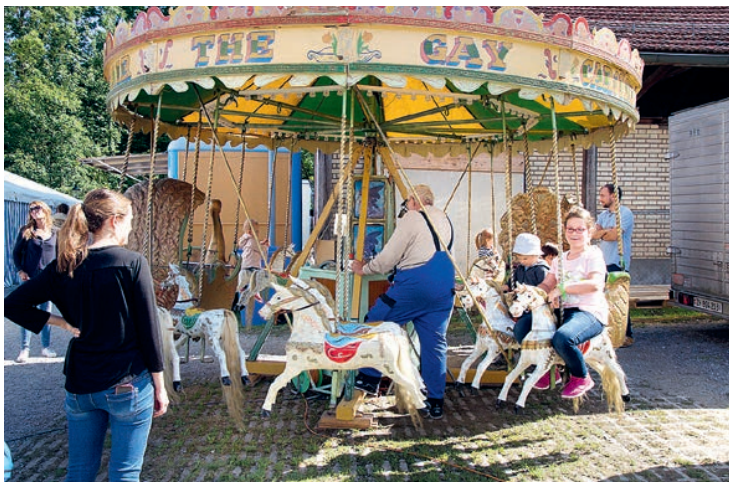
Karussellfahren ist der Hit!